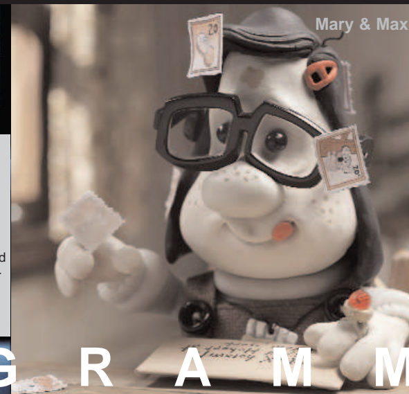
Mary & Max